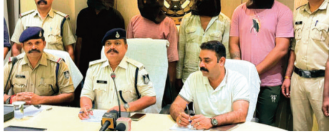
हरिभूमि न्यूज़ ▶▶ राजगढ़-ब्यावरा

महंगे शौक पूरे करने चोरी, लूट जैसी वारदातों को दे रहे थे अंजाम