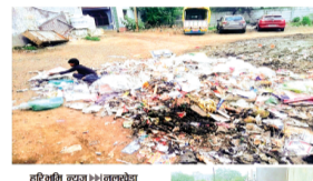
हरिभूमि न्यूज | नलखेड़ा

नगर के वाडं क्रमांक 4 पीलवास कालोनी में लगे कचरे के ढेर व गंदगी को लेकर बुधवार को हरिभूमि द्वारा प्रमुखता से प्रकाशित समाचार के बाद वाडं पार्षद व नगर परिषद अ म ला हरकत में आया और तत्काल मैदान में पड़े कचरे के ढेर को ट्रैक्टर ट्रॉली में भरवाकर ट्रेडिंग ग्राउंड भेजा तथा मैदान की सफाई करवाई गई।