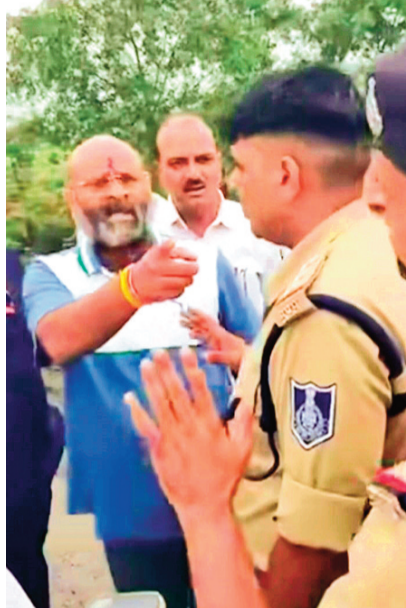
हरिभूमि न्यूज़ ▶▶ ब्यावरा

तराना विधायक परमार बोले- गोली मार दो मुझे !, टीआई बोले 150 से अधिक गाड़ियों की हुई है चैकिंग